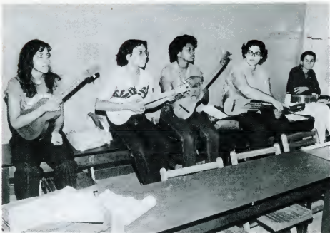
studenten op de A.P.A.

Rest ons in deze inleiding nog enkele opmerkingen over het concept scholing zelf. Met scholing wordt bedoeld alle vormen van onderwijs aan, vorming en training van leerkrachten (in spé). Hieronder vallen zowel de initiële opleiding als ook de gecontinueerde opleiding van de zittende